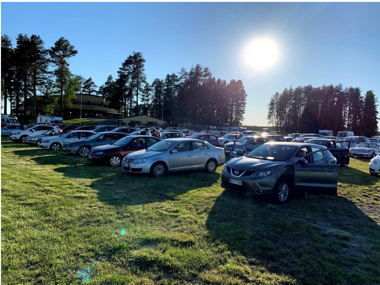
Vädret visade sin bästa sida när publiken njöt av drive-in konserten

Tommys spelade på en utescen och publiken körde in på parkeringen och satt i sina bilar och lyssnade på musiken. Konserten som startade klockan 19, samlade omkring 200 bilar med c:a 450 personer. Konserten filmades och streamades via pensionärsförbundets webbplats och förbundets Facebook sida. Dessutom sänds konserten i Lokal-TV kanalerna. Via den rikssvenska Dansbandssidan kunde man följa med konserten även i Sverige.